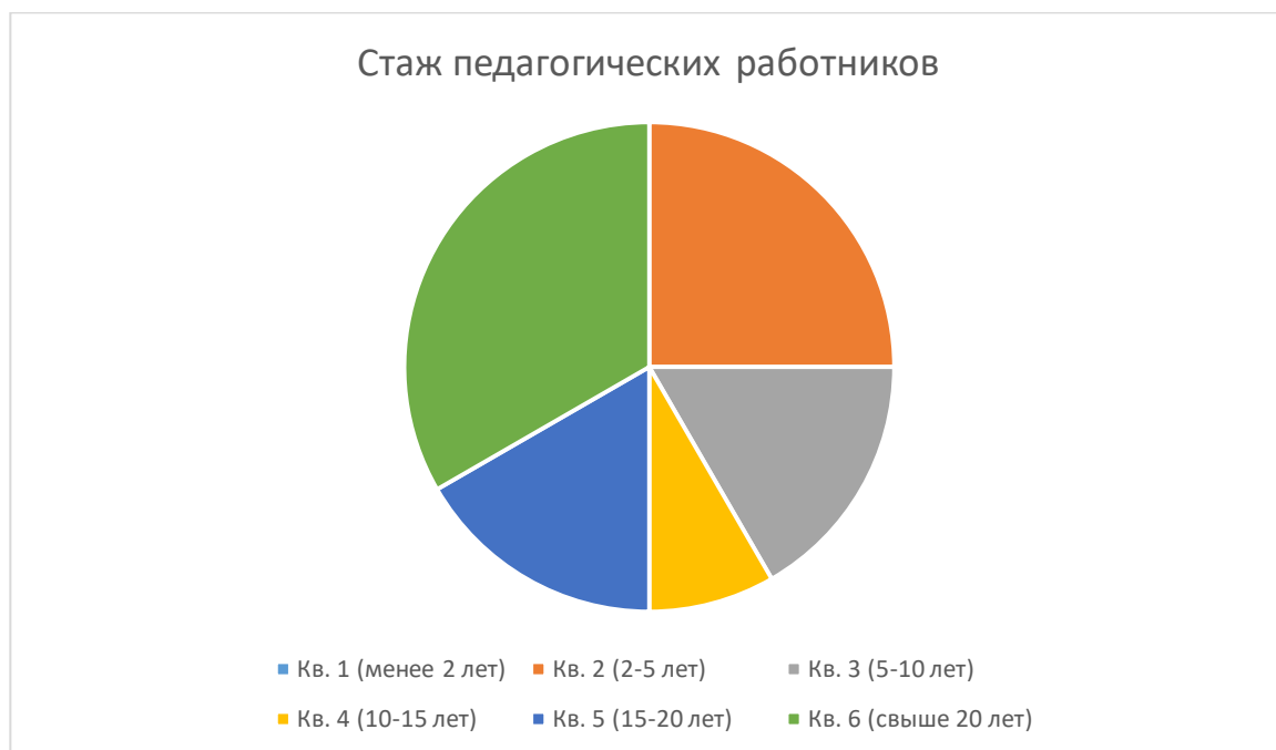
Диаграмма с характеристиками кадрового состава Детского сада.

Педагоги имеют следующие квалификационные категории.